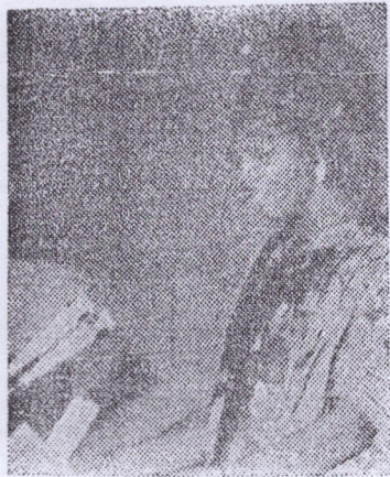
— Messages de l'Afrique

A la séance de clôture le camarade Ahmed Sékou Touré a prononcé un important discours dans lequel il s'est félicité de voir les femmes du PDG prendre conscience du problème complexe qui se pose à la société guinéenne. Mais avant de publier la résolution générale du 1er congrès des Femmes du PDG et l'important discours de clôture du Responsable Suprême de la Révolution guinéenne une retros-