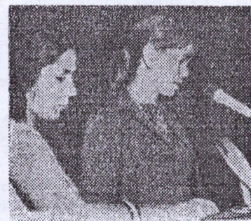
— De l'Amérique

En déclarant que, de ce 1er congrès des Femmes de Guinée sortiront des décisions tendant à