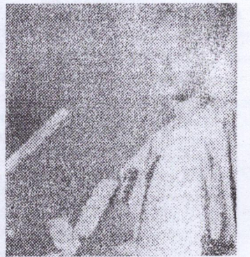
Et des guinéennes à l'étranger, au 1er Congrès National des Femmes.