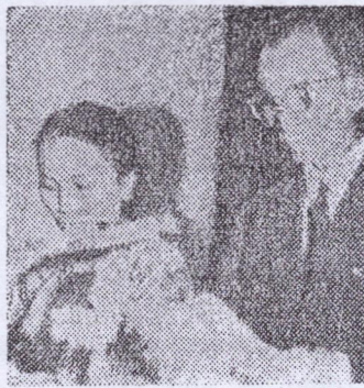
— De l'Asie

Pour la déléguée de la Tunisie, elle pense que cette tenue du 1er congrès des Femmes de Guinée est un symbole de l'expression