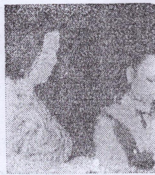
— De l'Europe

En conclusion, elles ont formulé le vœu de voir ce premier congrès des femmes de Guinée arriver à des conclusions posi-